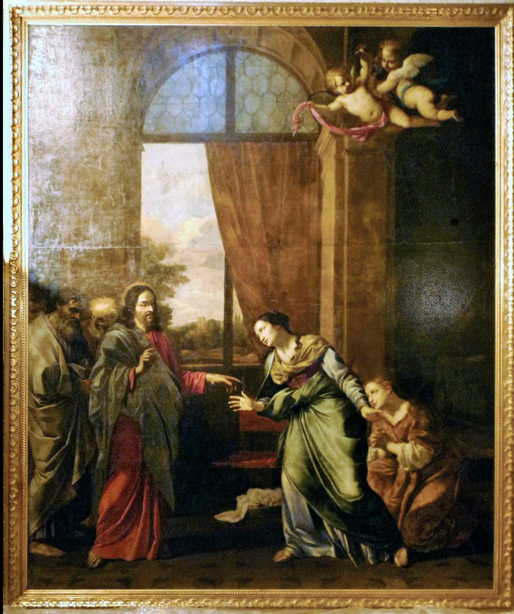
Arrivée du Christ à Béthanie Mignard