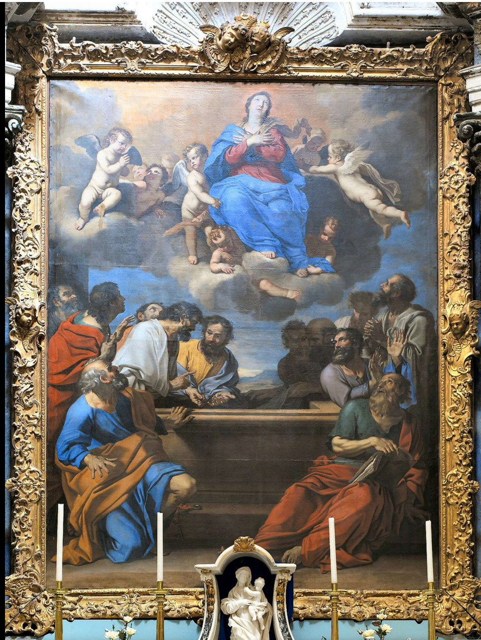
Ascension de la Vierge. Nicolas MIGNARD